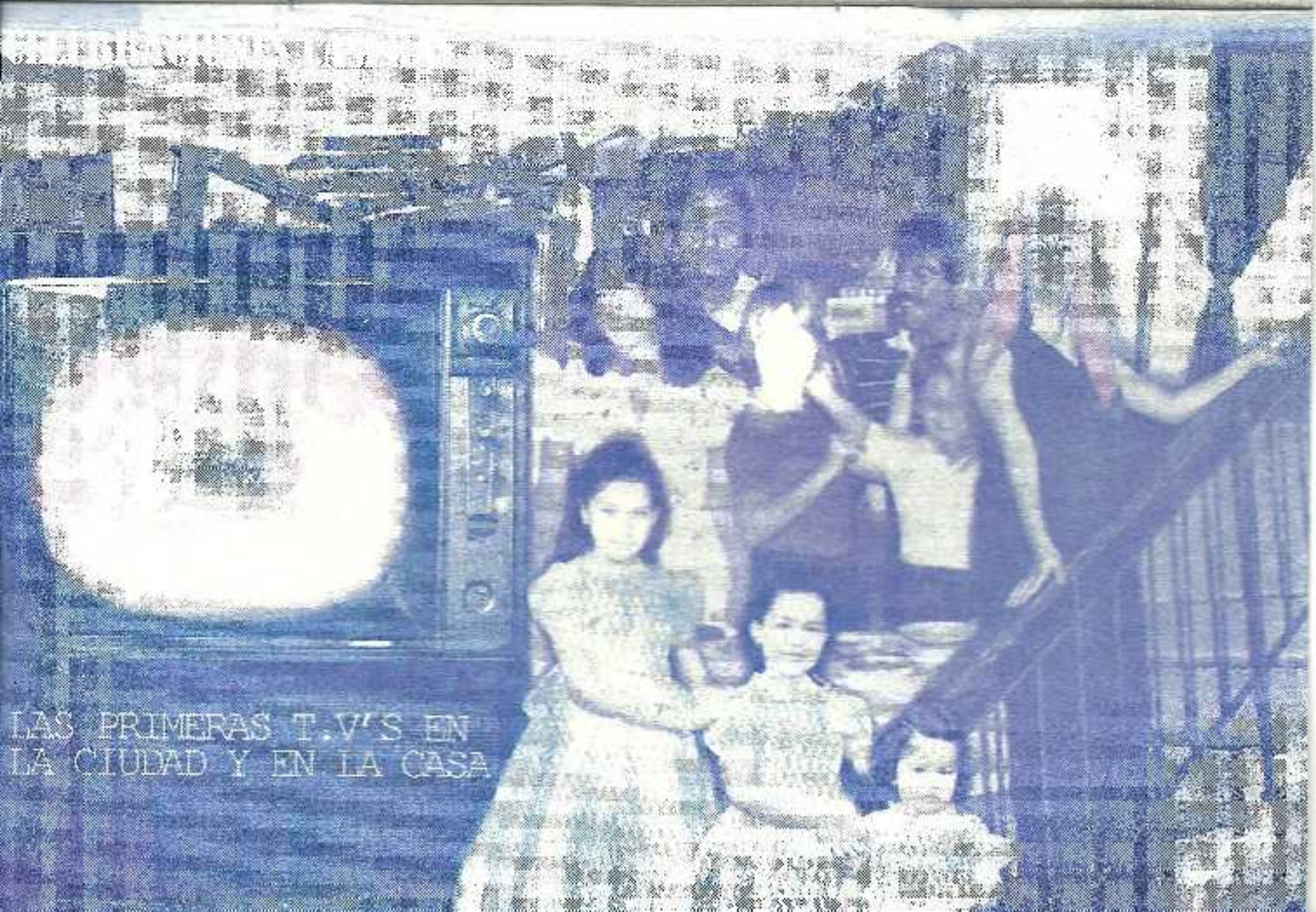
LAS PRIMERAS T.V.'S EN LA CIUDAD Y EN LA CASA

Real Academia Española © Todos los derechos reservados